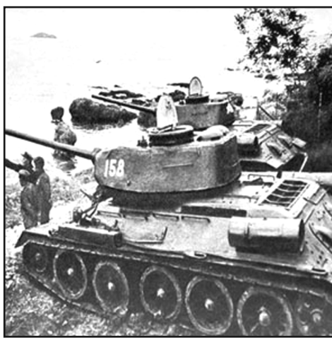
Советские танки на берегу Тихого океана