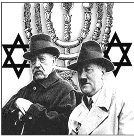
Гинденбург и Гитлер — «сладкая парочка»

В действительности есть в основном неписаная история, которая повествует о событиях, совершенно отличных от описанных нашими стерилизованными учебниками. Она повествует о преднамеренном создании войн, сознательном финансировании революций для смены правительств и об использовании конфликтов для установления Нового Мирового По-