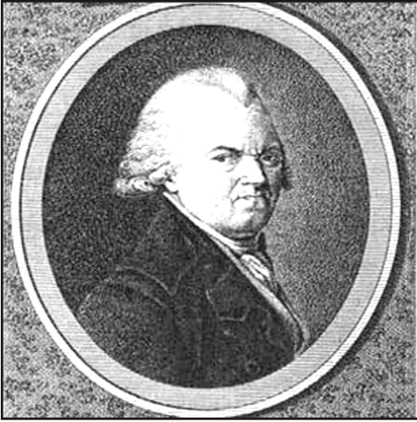
Август Людвиг Шлёцер, один из «русских» академиков

Разве можно соглашаться с подобными выводами «научных исследований»? Исконно русский дух никогда не примет